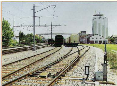
Goudgeel graan en zacht gloeiende heuvels. Zo kan de achterwand eruit zien. Het pakhuis van de ACB torent hoog boven het emplacement

plan ligt aan de 'graanlijn', van Payerne in het noorden tot Yverdon aan de zuidkant van het meer. Na Payerne gaat het graan verder naar Avanches en Fribourg, en vanuit Yverdon loopt het spoor verder tot aan Genève, maar daar houden we in ons sporenplan even geen rekening mee. Yverdon en Payerne zijn gecombineerd tot een schaduwstation (netje) achter de achterwand. In deze omgeving is het Frans en Duits erg verweven met elkaar, dus mogen beide talen in de opschriften voorkomen. Onze graanbaan mag dan in Zwit-