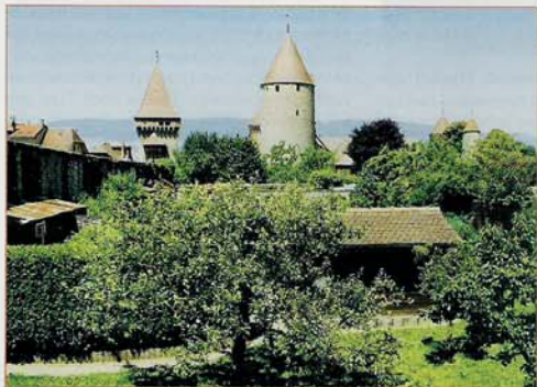
Het kasteel van Estavayer-Le-Lac zou zo uit een Faller-bouwpakket kunnen komen.

De rubriek Railhobby Junior, rubriek voor (her)starters, is de plaats waar de jeugdige en de herintredende Railhobby-lezer zijn of haar vragen kwijt kan.