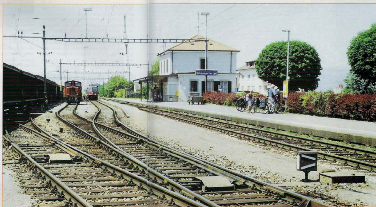
Station Estavayer-le-Lac. Rechts het doorgaande spoor, links de sporen van de graanoverslag.

Zin gekregen in een baan met graan? Ga eens aan de slag. Voorstel voor een achtergrondmuziekje: het (Spaanse) graan heeft de orkaan doorstaan.